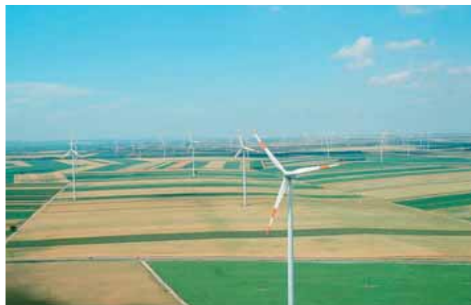
Windräder auf der Parndorfer Platte

zu erreichen über www.nickelsdorf.at unter der Rubrik „Forum“ (rechte Spalte)