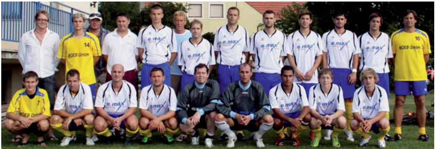
Die Kampfmannschaft des ASV Nickelsdorf ist gerüstet für den Aufstieg in die erste Klasse.