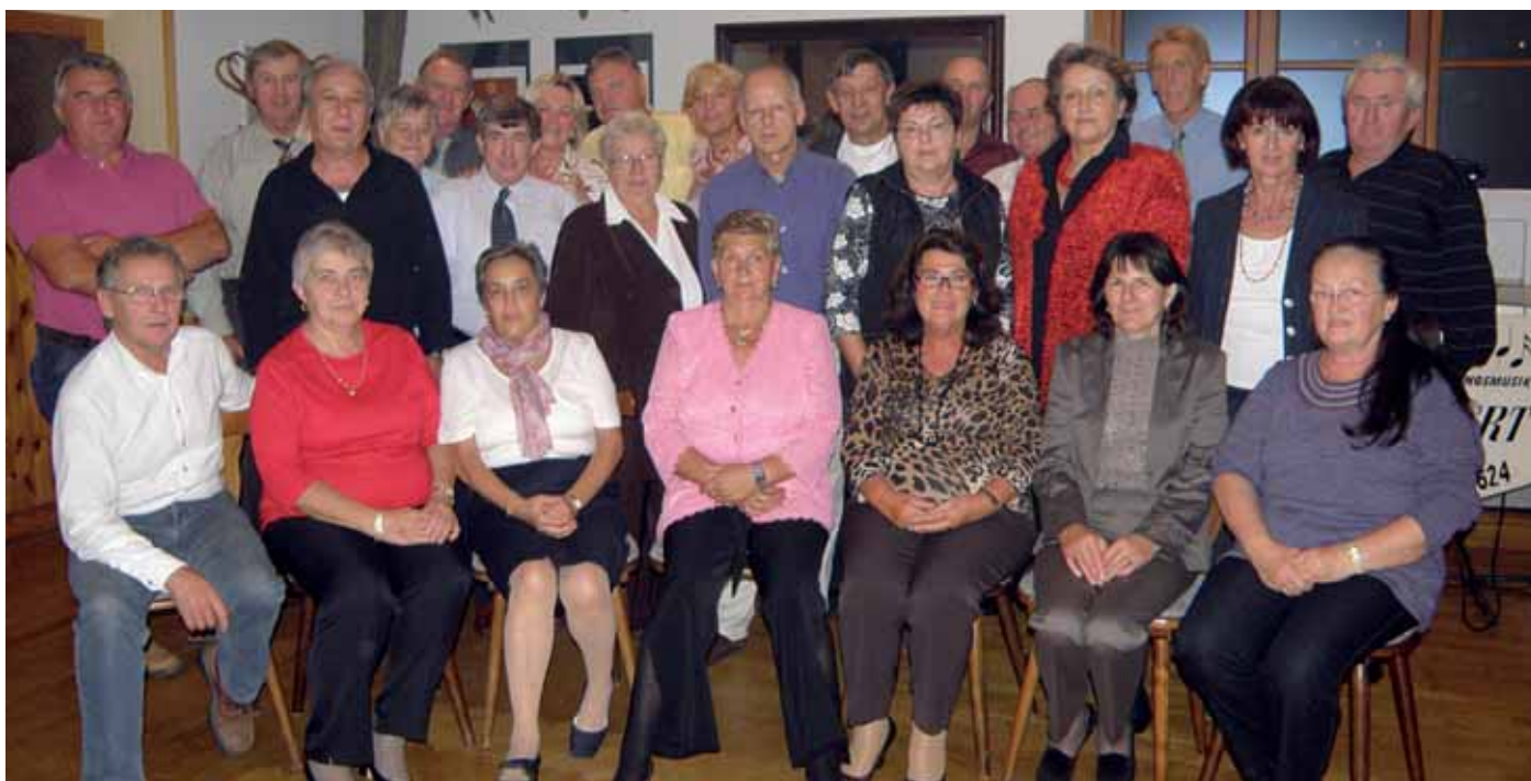
Am Samstag, dem 17. Oktober, fand im Gasthaus Weisz „Dorfwirt“ das Jahrgangstreffen all jener statt, die heuer ihren 60. Geburtstag feierten.