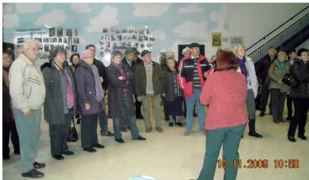
Besuch der Ortsgruppe Nickelsdorf im Flugmuseum Wiener Neustadt am 10.11.