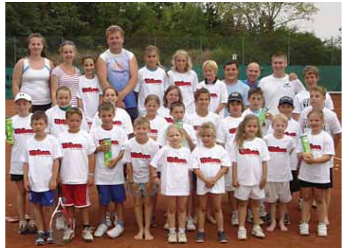
10. TCN4 Kids&Teens Jubiläumstenniscamp

Der TC Nickelsdorf veranstaltete Anfang August