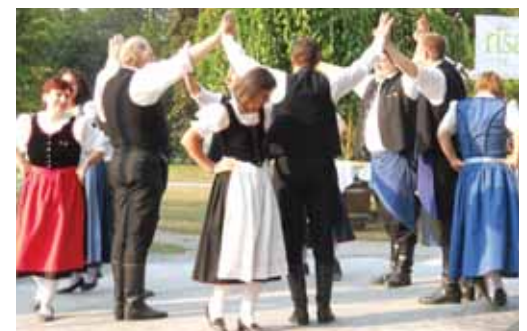
Die Volkstanzgruppe Nickelsdorf

Die Gemeinde Nickelsdorf und die Bevölkerung danken den Vereinen und allen Helfern für ein gelungenes Fest.