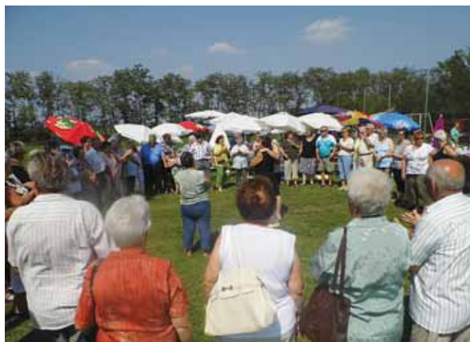
Verabschiedung der Gäste aus Pusztavam

Trotz hochsommerlicher Temperaturen haben sich am 28. Juli 2012 beim „Saubraten“ mit un-