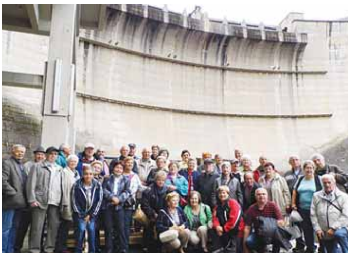
Pensionistengruppe vor der Staumauer in Ottenstein

47 Mitglieder der Ortsgruppe Nickelsdorf des Pensionistenverbandes haben am 13. Juni 2012 am Tagesausflug in die Brauerei Zwettl und zum Stauwerk Ottenstein teilgenommen. Nach Filmvorführungen und Besichtigung der Betriebe wurde um 16:00 Uhr die Heimreise angetreten.